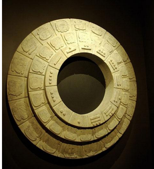
Innerer Ring – 13 Zahlen Mittler Ring – 20 Nahuales ( Tagesherren) Äußerer Ring – 19 Gottheiten

Diese Zahnräder passen jedoch nur nach bestimmten Regeln zusammen. Jedes der 20 Nahuales des Tuns z.B. muss genau zu den dreizehn Uinals passen, die eine Tzolkin-Runde ausmachen. Denn jedes Rad in dem auf dem Tun fußenden System ( Tuns, Katuns, Baktuns usw.) hat zwanzigmal mehr Zähne als das innere Rad, und das innere Rad dreht sich zwanzigmal in derselben Zeitspanne, in der sich das äußere einmal dreht. Dadurch wird klar, dass jeder Zeitzyklus seine eigenen Rotationsfrequenz hat und dass diese Frequenz in den unterschiedlichen Unterwelten verschieden ist.